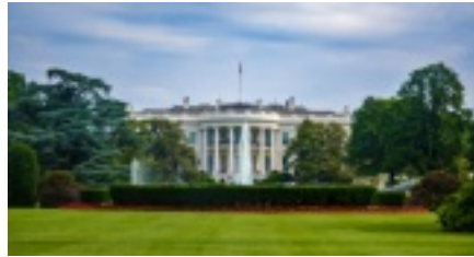
Das Weiße Haus.

Der Kampf ums Weiße Haus wird zwar zwischen Donald Trump von den Republikanern und Joe Biden von den Demokraten entschieden. Allerdings versuchen auch Kandidat*innen kleinerer, so genannter "Third Parties" oder "Smaller Third Parties" und unabhängige Kandidat*innen ihr Glück bei den diesjährigen US-Präsidentenwahlen. Wir stellen Ihnen die "Underdogs" der US-Wahlen 2020 vor.