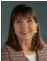
Jo Jorgensen.

Joanne Marie "Jo" Jorgensen (63) tritt für die Libertarian Party an, der sie seit 1983 angehört. Sie kann von allen 538 Wahlmännern und Wahlfrauen des Electoral College gewählt werden. Die Libertarian Party setzt sich für freie Marktwirtschaft und einen Minimalstaat ein. Die Rechte und die Selbstverantwortung des/der einzelnen Bürger*in stehen dagegen im Mittelpunkt.