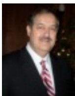
Don Blankenship.

Donald Blankenship (70) ist Kandidat der konservativen Constitution Party, die sich politisch rechts von der Republikanischen Partei verortet. Er wuchs in West Virginia auf und arbeitete nach der Schule als Buchhalter. Mit Anfang 30 wechselte zu einem der größten Kohleunternehmen der USA, wo er Karriere machte und zuletzt als Geschäftsführer tätig war.