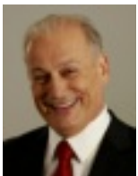
Rocky De La Fuente.

Rocky De La Fuente (66) trat zunächst als einer der Kontrahenten von Donald Trump für die Republikaner an, scheiterte jedoch in den Vorwahlen. Nun kandidiert er für die Alliance Party, die sich politisch zwischen der Republikanischen und der Demokratischen Partei verortet.