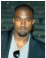
Kanye West.

Kanye West (43) ist ein bekannter Rapper, Sänger und Musikproduzent. Er gehört zu den weltweit erfolgreichsten Musikern und hat zahlreiche Auszeichnungen und Preise gewonnen. In der Vergangenheit unterstützte er öffentlichkeitswirksam Präsident Donald Trump, äußerte jedoch auch seine Absicht, selbst für das Präsidentenamt zu kandidieren. Am 4. Juli 2020, dem Unabhängigkeitstag der USA, kündigte West offiziell seine Kandidatur für die diesjährige Präsidentschaftswahl an.