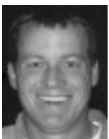
Bill Hammons.

Bill Hammons (46) wurde in Deutschland als Sohn eines Armeemoffiziers geboren und wuchs in Texas auf, wo er derzeit lebt. Er gründete 2004 die Unity Party of America, für die er bereits für den Senat (2014, 2016) und das Gouverneursamt (2018) kandidierte, jeweils für den Bundesstaat Colorado. Die Unity Party of America positioniert sich politisch zwischen der Demokratischen und der Republikanischen Partei.